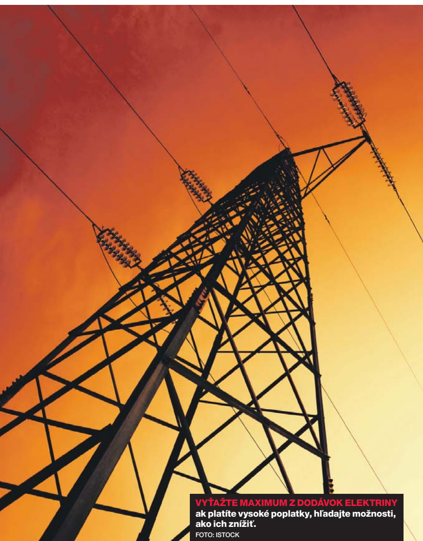
VYŤAŽTE MAXIMUM Z DODÁVOK ELEKTRINY ak platíte vysoké poplatky, hľadajte možnosti, ako ich znížiť.

túre cien a tomu, ako sa jednotlivé technické parametre premietajú do ceny. Keď k tomu pripočítame fakt, že energetické spoločnosti sú všeobecne vykresľované ako čierne diery pohlcujúce „ich“ peniaze a alternatívni dodávatelia boli donedávna považovaní za zbytočný medzičlánok, je pochopiteľné, že náklady na vstupné komodity vyvolávajú často hnev a nespokojnosť. V tomto smere je najlepším riešením práve informovanosť.“